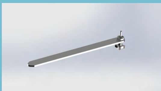
製品名:角支柱 製品番号 PO-003-400