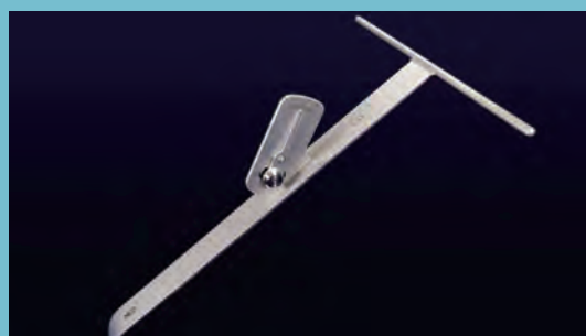
製品名:AL60 骨盤角度計 製品番号 PO-010-040