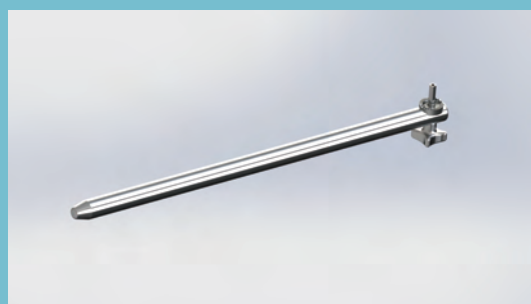
製品名:八角支柱 製品番号 PO-003-500

届出番号 26B2X10024000236 器01 手術台及び治療台 一般医療機器 手術台アクセサリ (70469000) プラスオーソ イージーポジショナー